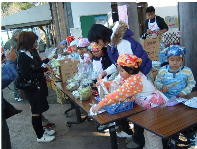
♪ 元気な売り子さんたち。飛ぶように売れています。