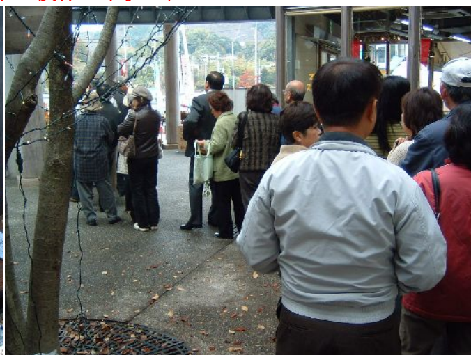
♪ 『行列のできる店』状態。

今年もやって来ました、奈路(なろ)っ子の季節。風良里からもほど近い南国市中山間にある奈路小学校の児童達が育てたお芋と手作り木炭『奈路(なろ)っ子炭』の毎年恒例の店頭販売、上記のとおり今年も 12 月 18 日(木)に開催決定。大人気で毎年午前中には完売の超人気イベントです。10 時より販売開始ですが、上右画像のとおり販売開始前より行列のできる状態。売り切れ次第終了となりますので、お早めにお越し下さい。 ☆ がんばるゾ!! 元気な奈路っ子たち。