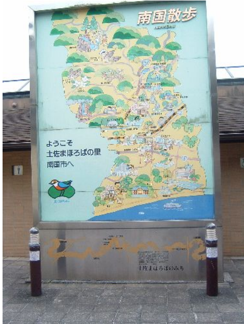
♪ 地図盤の左右にあるんです。

充分おつりが来るくらいかかります。今迄割った人に代金を請求したことはありませんが、今後あんまりな理由だと、弁償をお願いするケースも生じましょう。だから、良い子も悪い子も