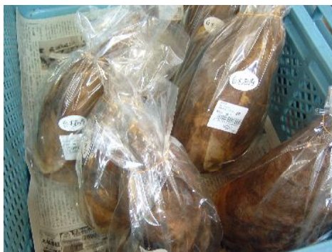
♪ シャクシャクの食感 おいしいゾ〜。

駅内 JA 南国市直売所「風の市」にもう早掘りたけのこが出ています。有名な白木谷(しらきだに)産の朝掘り新鮮筍。