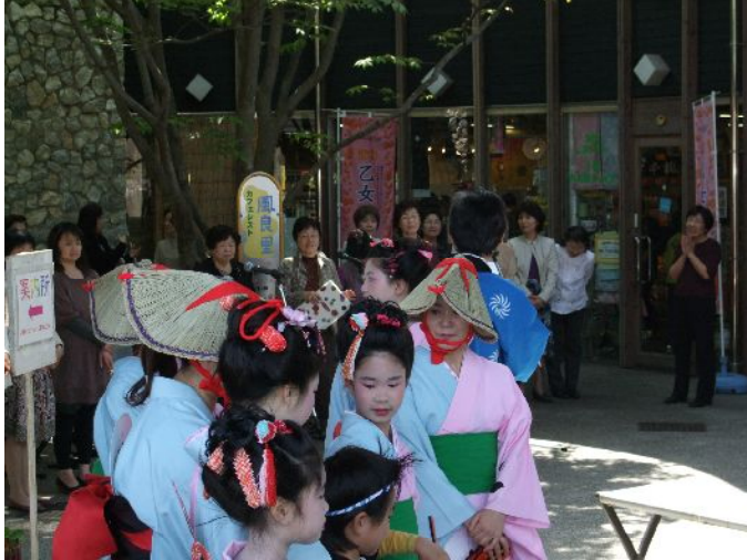
♪ 出演者の皆さん。踊りのふじ和会さんとコーラスグループ。