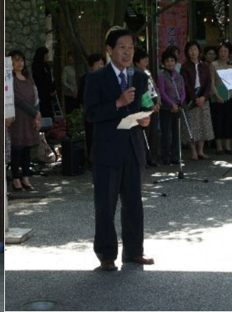
♪ 主催者挨拶 会長さんです。