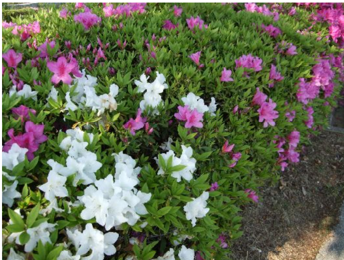
♪ 紅白のコントラストが見事でしょ!!