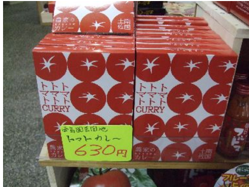
♪ お近くの西島園芸団地のトマトカレー。大ヒット中。

お土産のショップ風良里は、トレンドに敏感なスタッフによって商品を選定し、特色のある棚づくりを目指しています。生姜コーナーに続いてのスタッフの提案は『トマトコーナー』。高知の特産トマト関連商品を豊富に品揃え。 ♪見てね!!