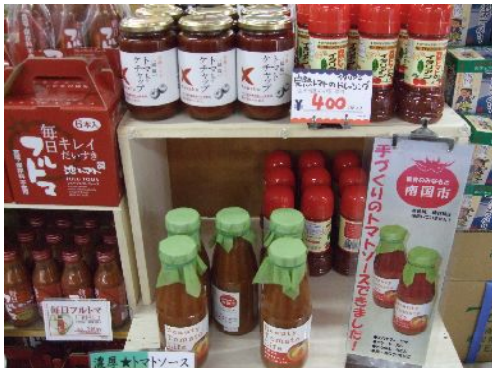
♪ ほらネ、あったでしょう!!